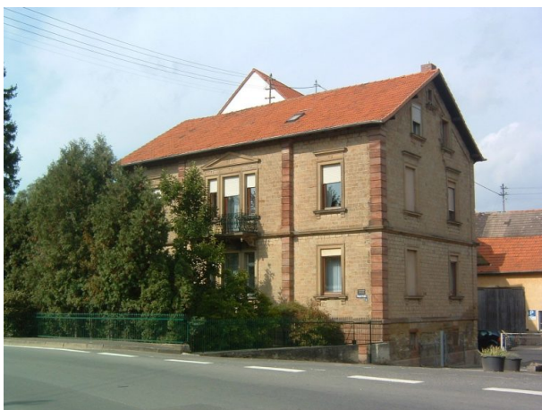
Blick von der Hauptstraße auf die Daubhausmühle in Alsenz (VG Alsenz-Obermoschel, um 2008)

Sonja Kasprick am 28.01.2020 um 15:03:19Uhr