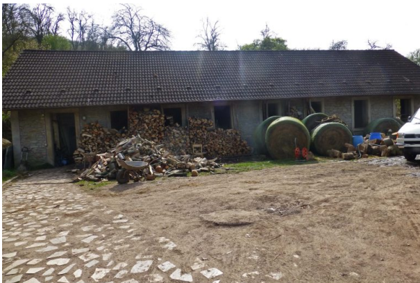
Wirtschaftsgebäude des einstigen Kalkwerks