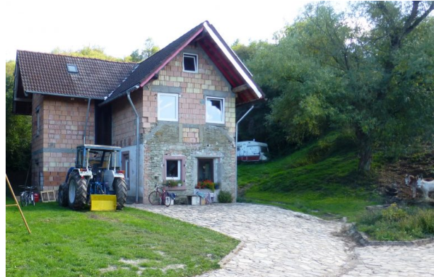
Wohnhaus auf dem Gelände des einstigen Kalkwerks (OG Hinzweiler/ Werner Lang, 2015)