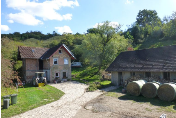
Ehemaliges Kalkwerk Hein bei Hinzweiler (OG Hinzweiler/ Werner Lang, 2015)