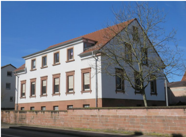
Ehemaliges Pfarrhaus - heute städtischer Kindergarten (Helge Ebling, 2018)