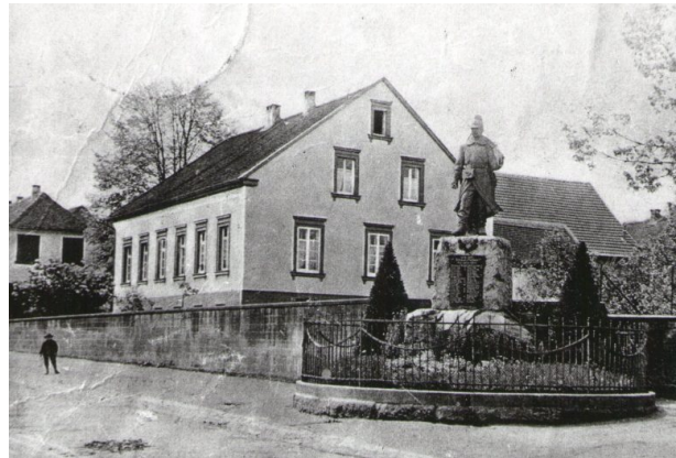
Ehemaliges Pfarrhaus. Im Vordergrund ist das Kriegerdenkmal des deutsch-französischen Krieges zu sehen (unbekannt, um 1920)