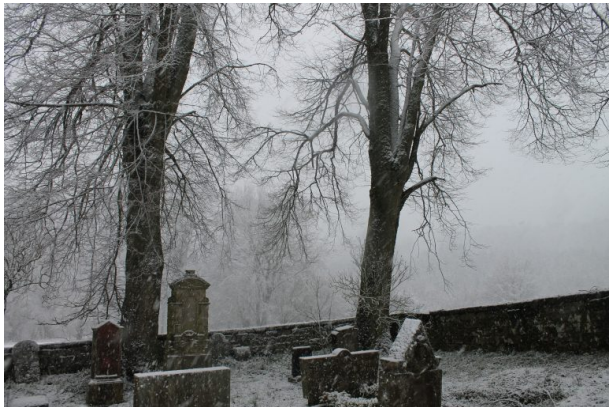
Mennonitenfriedhof - Gräber rechte Seite (Marcel Krupka, 2020)