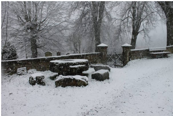
Mennonitenfriedhof am Wilensteinerhof (Marcel Krupka, 2020)

Marcel Krupka / Artur Bomke am 02.03.2020 um 16:36:02Uhr