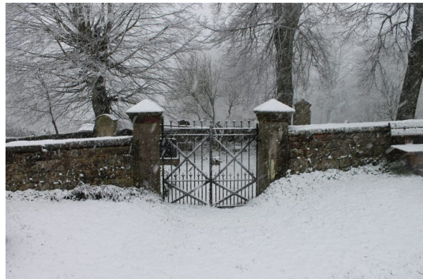
Mennonitenfriedhof - Eingang (Marcel Krupka, 2020)