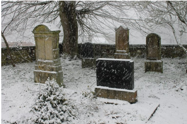
Mennonitenfriedhof - Gräber linke Seite (Marcel Krupka, 2020)