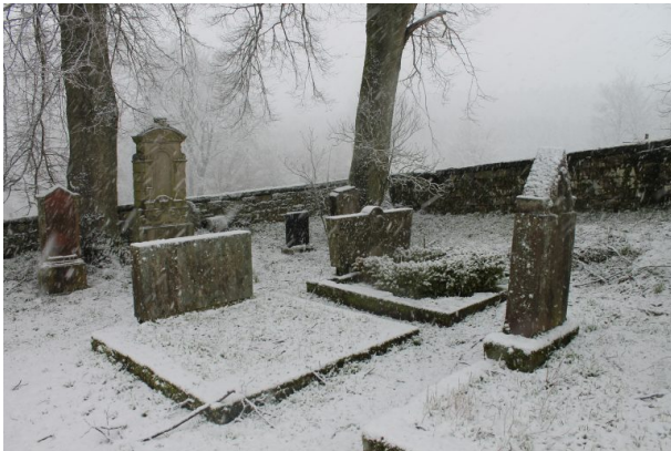
Mennonitenfriedhof - Gräber rechte Seite (Marcel Krupka, 2020)