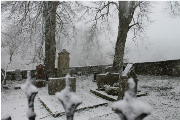
Mennonitenfriedhof - Gräber rechte Seite (Marcel Krupka, 2020)