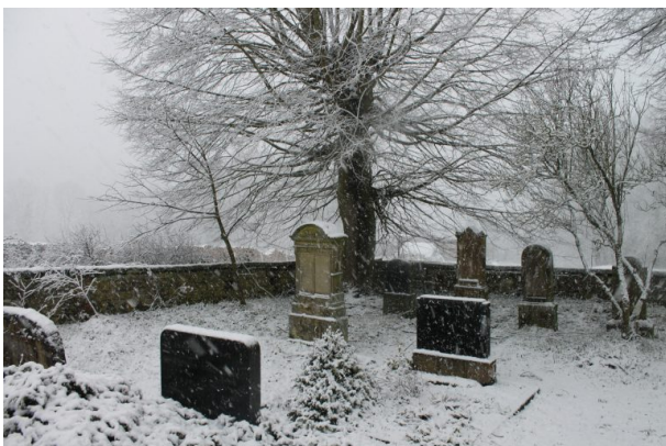
Mennonitenfriedhof - Gräber linke Seite (Marcel Krupka, 2020)