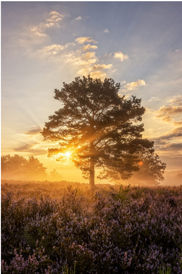
Heideblu?te in der Mehlinger Heide (Manuel Becker)