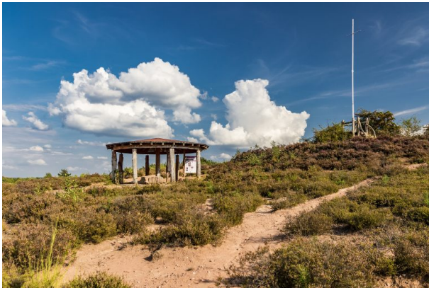
Aussichtspunkt auf dem Feldherrenhügel in der Heide (Adolf Beck, 2018)