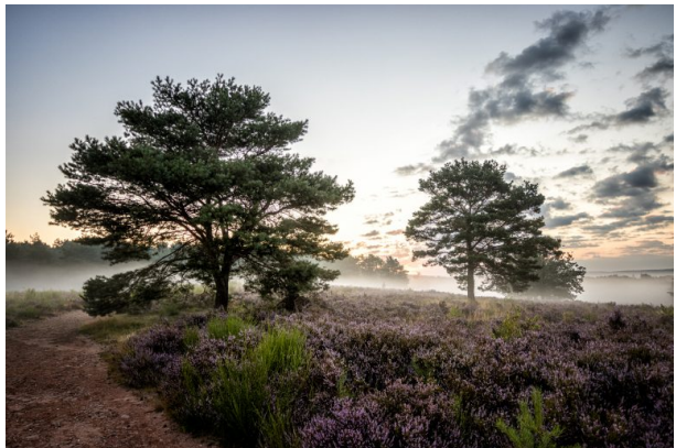
Heideblu?te in der Mehlinger Heide (Manuel Becker)