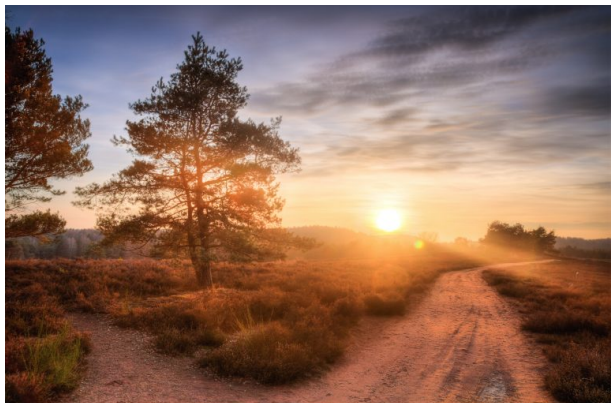
Mehlinger Heide während der Blüte (Andreas Gläser, 2013)