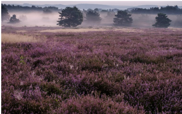
Mehlinger Heide bei Sonnenaufgang (Anna Wojtas, 2013)