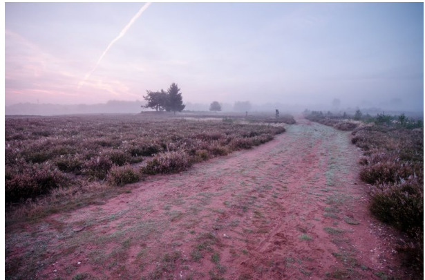
Mehlinger Heide (Anna Wojtas, 2013)