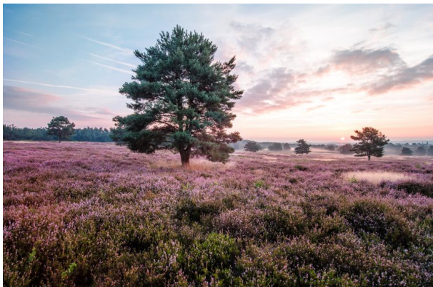
Mehlinger Heide (Anna Wojtas , 2013)

Dana Taylor am 27.10.2020 um 10:07:24Uhr