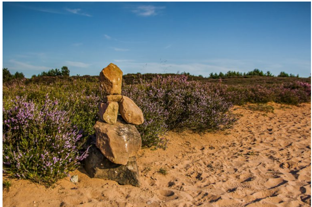
Mehlinger Heide im Sommer (Adolf Beck, 2017)