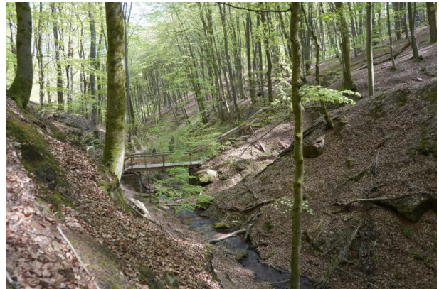
Elendsklamm bei Bruchmühlbach (Dana Taylor , 2020)