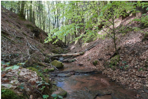
Elendsklamm in Bruchmühlbach (Dana Taylor , 2020)