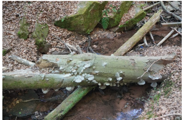
Baumpilze an einem Totholzstamm in der Elendsklamm (Dana Taylor , 2020)