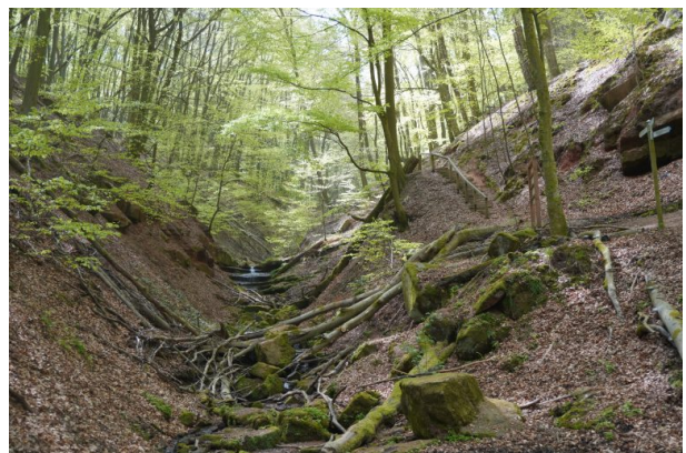
Elendsklamm in Bruchmühlbach (Dana Taylor , 2020)