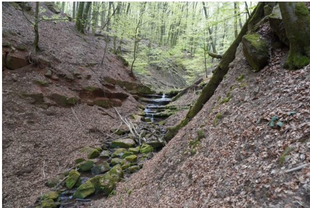
Wasserfall in der Elendsklamm (Dana Taylor , 2020)