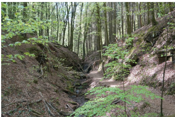
Stufenförmige Kaskaden und kleiner Wasserfall in der Elendsklamm (Dana Taylor , 2020)