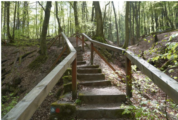
Wanderweg durch die Elendsklamm (Dana Taylor , 2020)