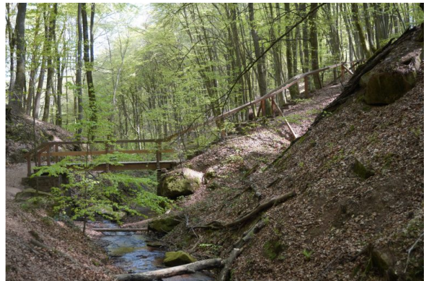
Bachlauf des Frohnbachs in der Elendsklamm (Dana Taylor , 2020)