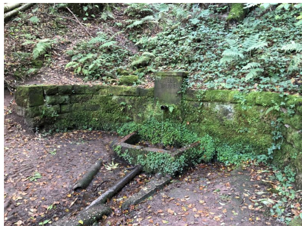
Teufelsbrunnen im Gersbachtal bei Pirmasens-Niedersimten (Dana Taylor, 2021)