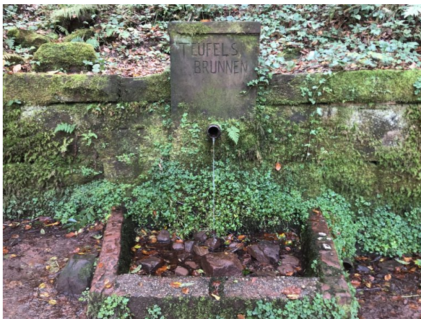
Teufelsbrunnen im Gersbachtal bei Pirmasens-Niedersimten (Dana Taylor, 2021)

Dana Taylor am 20.04.2021 um 09:45:38Uhr