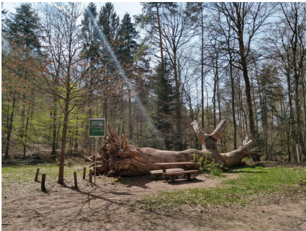
Naturdenkmal "Dicke Eiche" (Jennifer Laessing, 2021)

Dana Taylor am 27.04.2021 um 10:06:58Uhr