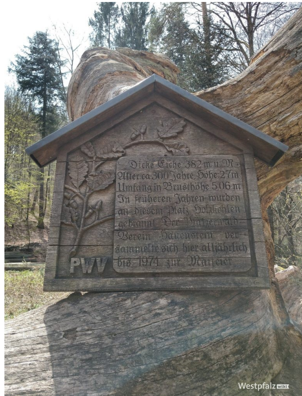
Informationstafel des PWV (Jennifer Laessing, 2021)