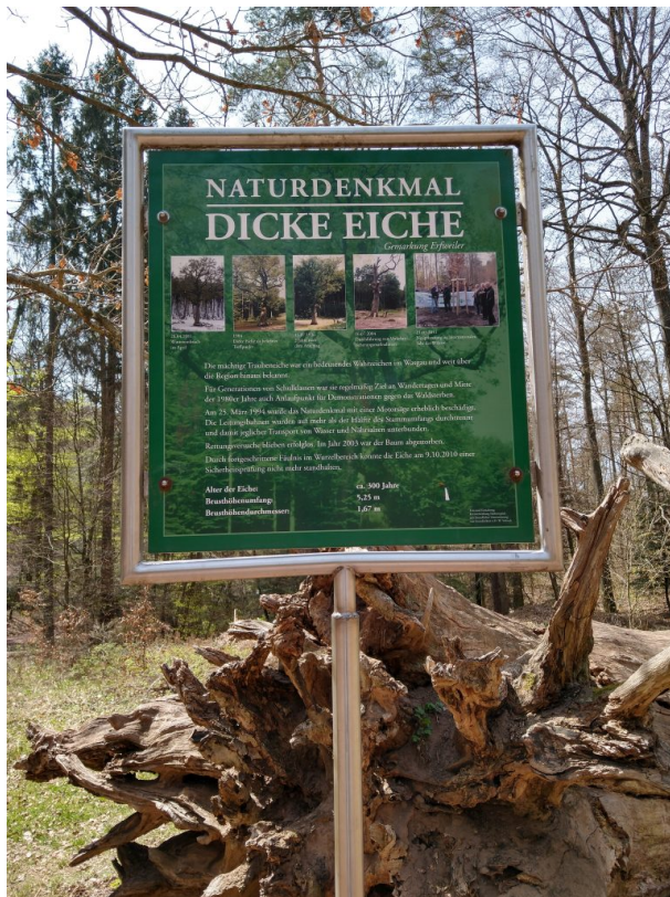
Informationstafel zur "Dicke Eiche"