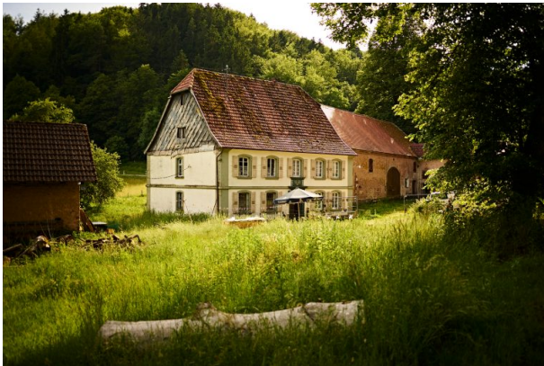
Blick auf das Haupthaus der Knoppermühle mit den anschließenden Wirtschaftsgebäuden