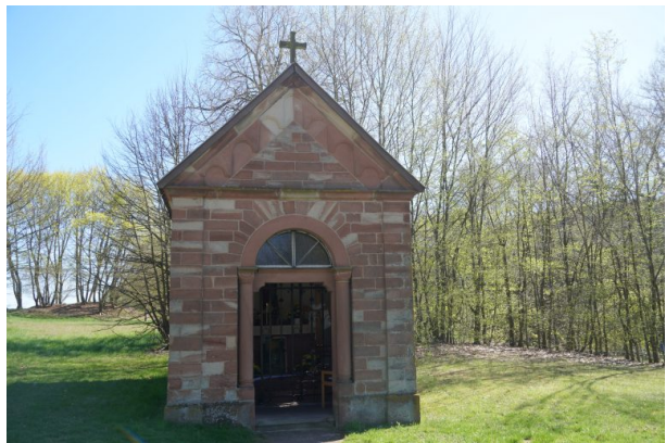
Barbara-Kapelle in Bann (Dana Taylor, 2022)