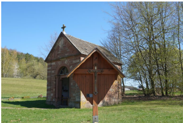
Barbara-Kapelle in Bann (Dana Taylor, 2022)

Dana Taylor am 21.04.2022 um 08:22:35Uhr