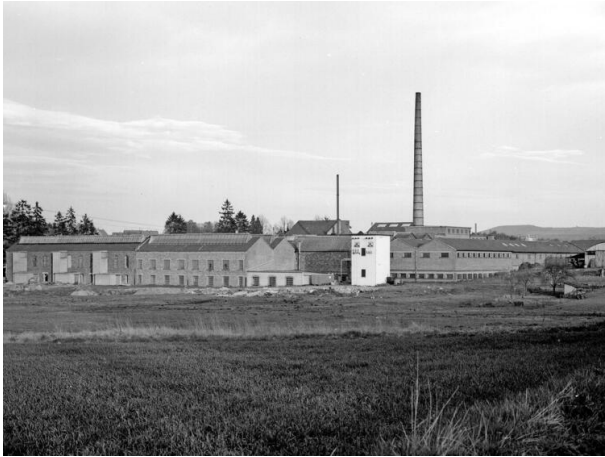
Blick auf die Firma-Süßdorf-und-Cie im 20. Jahrhundert