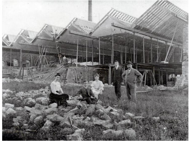
Die Familie Süßdorf um 1900 vor dem im Bau befindlichen Buntweberei