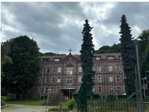
(Philipp Markgraf, 2024)

Philipp Markgraf am 26.10.2022 um 11:14:48Uhr