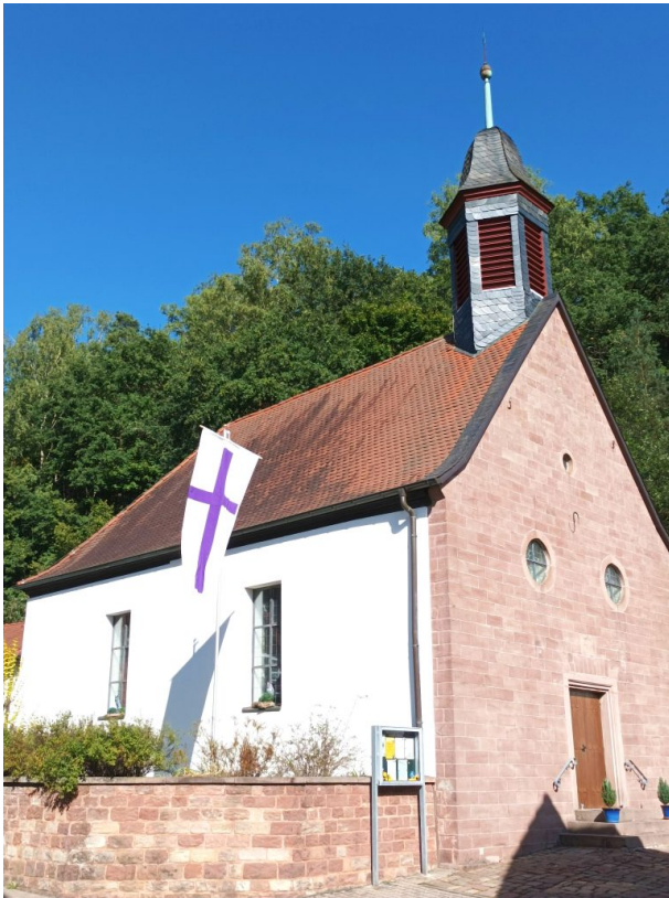
Außenansicht der Kirche (Pfarramt Schopp)