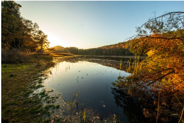
Pfälzerwoog bei Abenddämmerung (Harald Kröher, 2020)

Philipp Markgraf am 14.09.2022 um 12:43:43Uhr