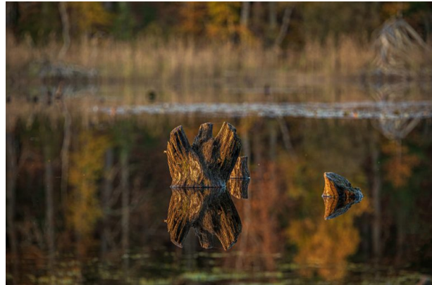
Objekte spiegeln sich wunderschön auf der Wasseroberfläche (Harald Kröher, 2020)