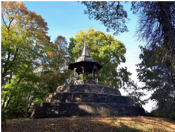
Schneckenturm beim Schillerhain in Kirchheimbolanden (Dr. Hans-Günther Clev, 2018)

Raphaela Maertens am 20.03.2019 um 09:22:57Uhr