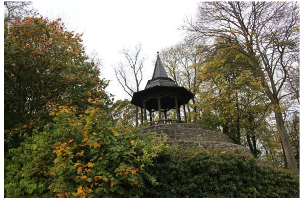
Schneckenturm beim Schillerhain in Kirchheimbolanden (Arne Schwöbel, 2017)