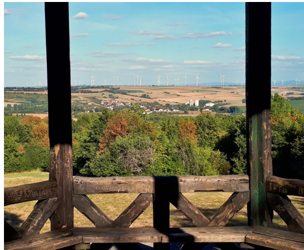
Aussicht vom Schneckenturm in Kirchheimbolanden (Dr, Hans-Günther Clev, 2018)