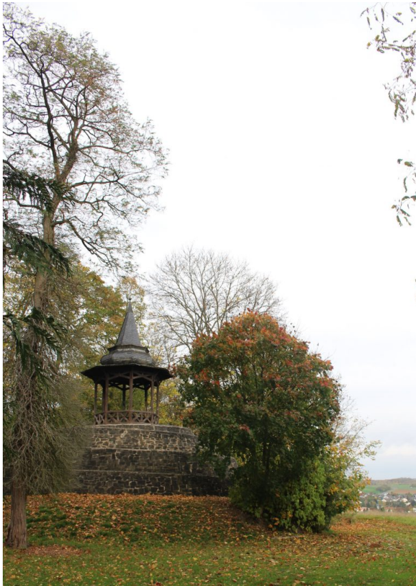
Schneckenturm beim Schillerhain in Kirchheimbolanden (Arne Schwöbel, 2017)