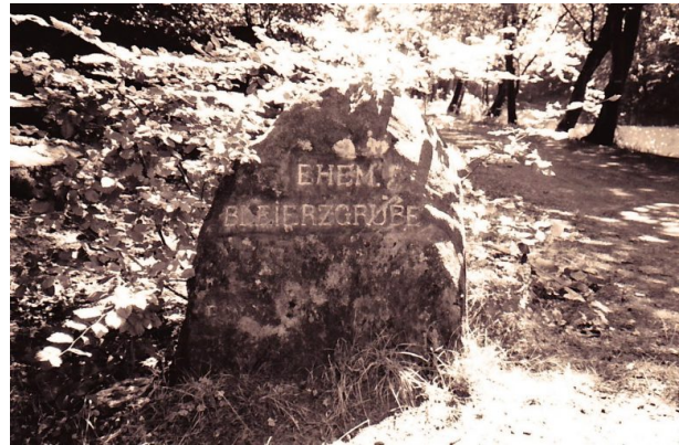
„Ehem. Bleierzgrube“ (Ritterstein Nr. 29) (Erhard Rohe, 1993)