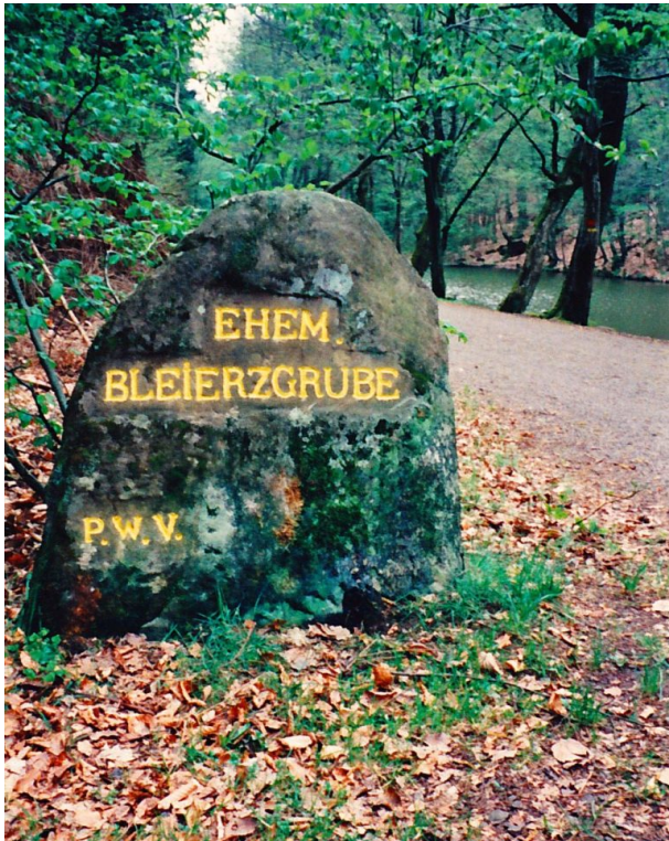
„Ehem. Bleierzgrube“ (Ritterstein Nr. 29) (Erhard Rohe, 1998)