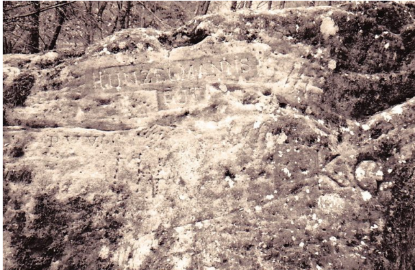
Ritterstein „Kunzelmannsgut“ (Ritterstein Nr. 39) am Wegesrand an der Wieslauter im vorderen Ziegelstal nördlich von Hinterweidenthal (Erhard Rohe, 1993)