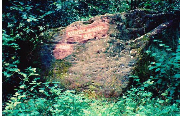
Ritterstein „Kunzelmannsgut“ (Ritterstein Nr. 39) am Wegesrand an der Wieslauter im vorderen Ziegelstal nördlich von Hinterweidenthal (Erhard Rohe, 1994)