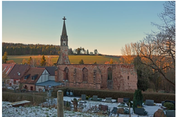
Sicht auf die Ruine des Kloster St. Maria in Rosenthal aus westlicher Richtung.