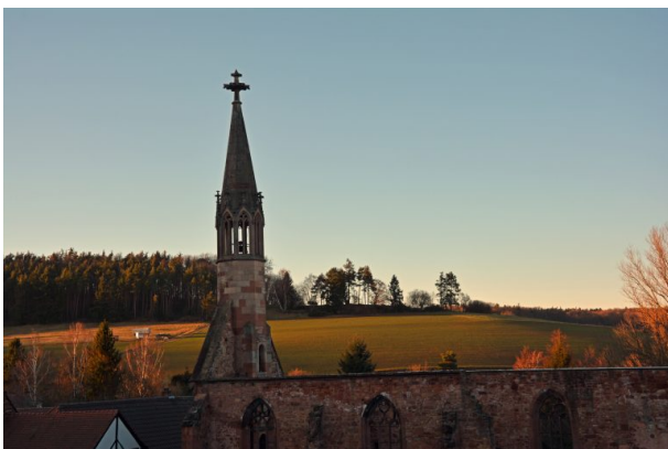
Sicht auf die Ruine des Kloster St. Maria in Rosenthal aus westlicher Richtung. (Sonja Kasprick, 2018)