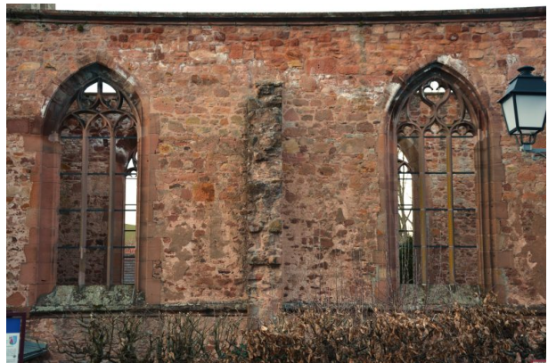
Blick auf die Außenwand des Kloster St. Maria in Rosenthal aus westlicher Richtung. (Sonja Kasprick, 2018)