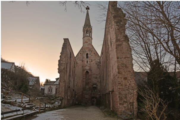
Die Ruine des Kloster St. Maria in Rosenthal aus östlicher Richtung. (Sonja Kasprick, 2018)