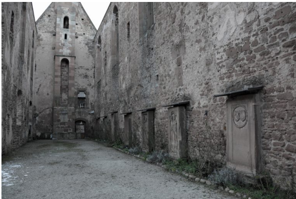
Ruine des Kloster St. Maria in Rosenthal. (Sonja Kasprick, 2018)