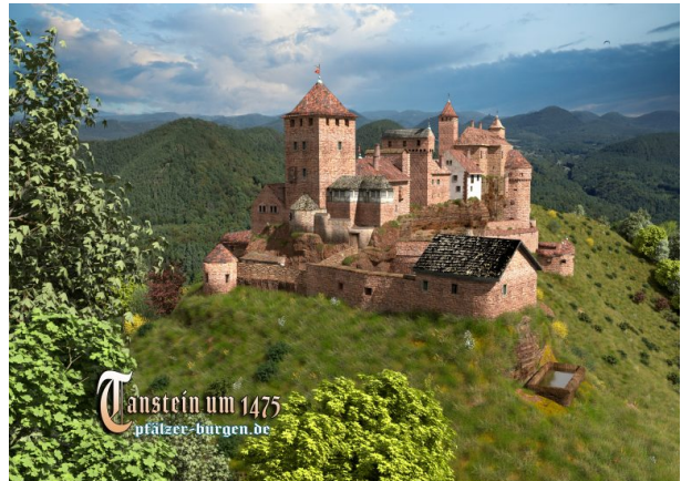
Rekonstruktion der Burg Tanstein (Südwest Ansicht) um 1475 von Peter Wild (pfälzer- burgen.de)