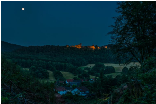
Blick auf die Burgengruppe Dahn bei Vollmond. (Stefan Engel, 2015)