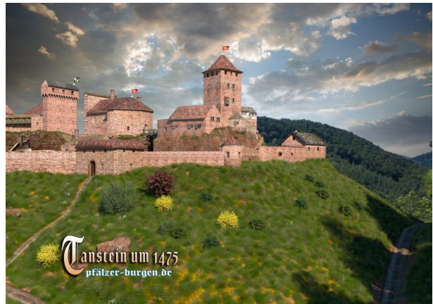
Rekonstruktion der Burg Tanstein (Nordwest Ansicht) um 1475 von Peter Wild (pfälzer- burgen.de)