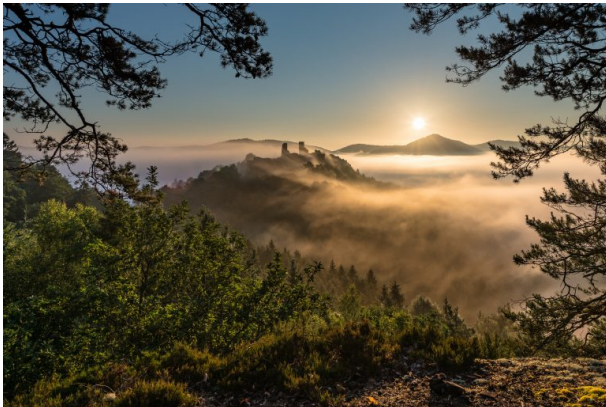
Blick auf die Burgengruppe Dahn bei Nebel. (Stefan Engel, 2015)