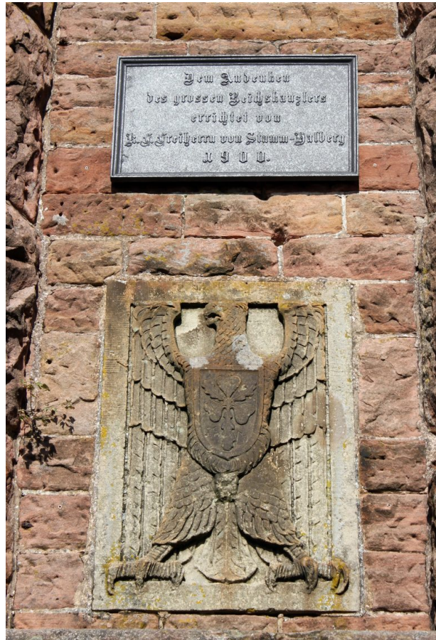
Widmungstafel mit Inschrift und Reichsadlerrelief des Bismarckturms in Landstuhl (2010). Die Inschrift lautet: "Dem Andenken des grossen Reichskanzlers errichtet von K.F. Freiherr von Stumm-Halberg 1900."