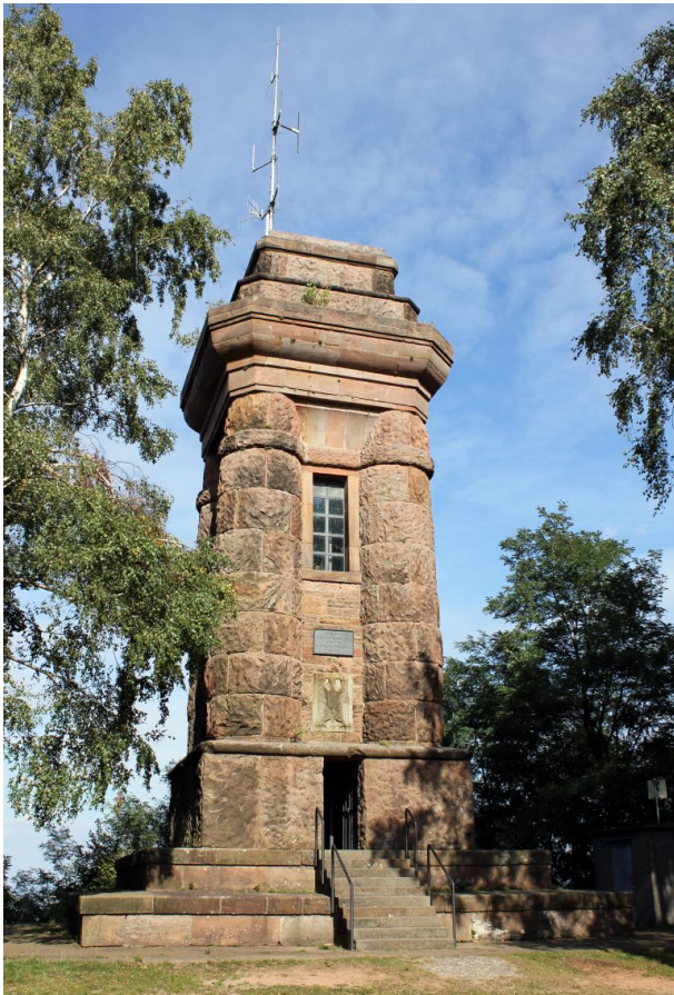
Blick auf den Eingangsbereich des Bismarckturms in Landstuhl ( Werner Lademann, 2010)