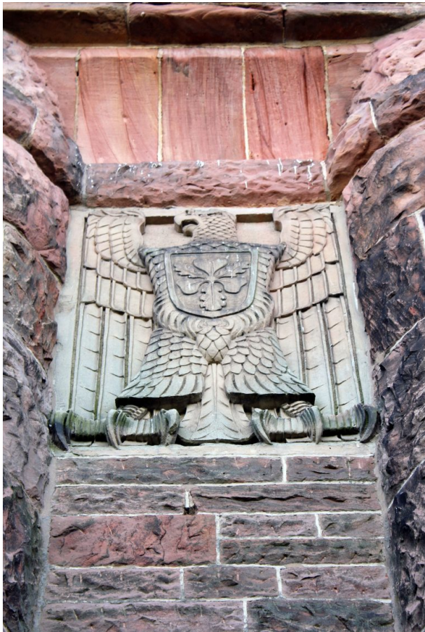
Reichsadlerrelief auf der Westseite des Bismarckturms in Landstuhl (Werner Lademann, 2010)