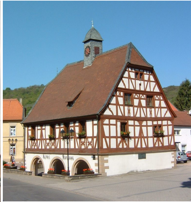
Altes Rathaus Alsenz (Arno Mohr , 2013)