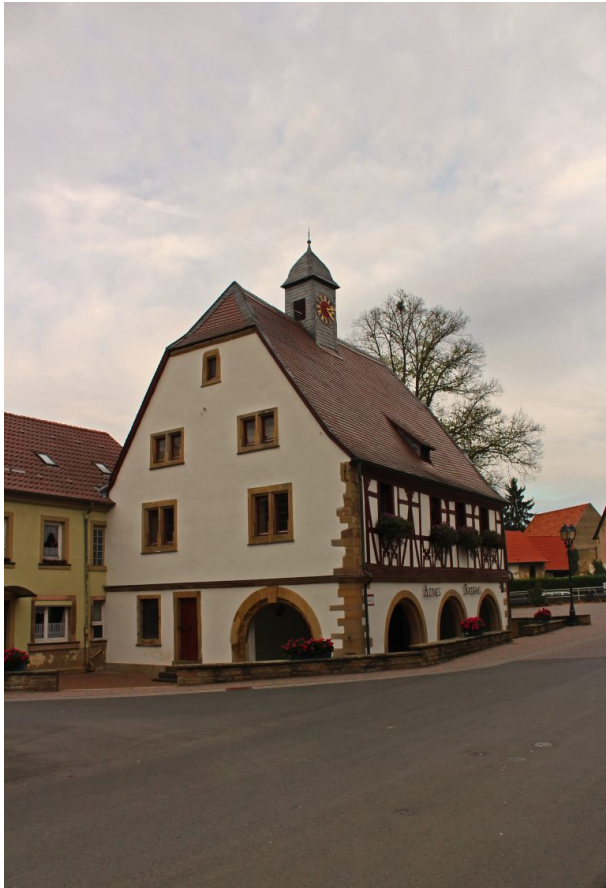
Altes Rathaus in Alsenz (Arne Schwöbel, 2017)