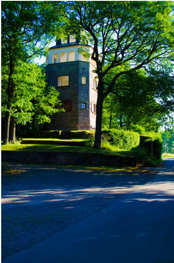
Eulenkopfturm in Eulenbis (Sandra McNeil-Siebenlist, 2015)