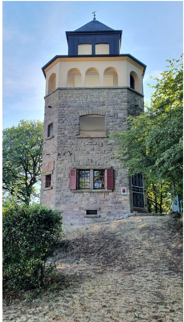
Eulenkopfturm auf dem Eulenkopf (Peter Herzer, 2022)