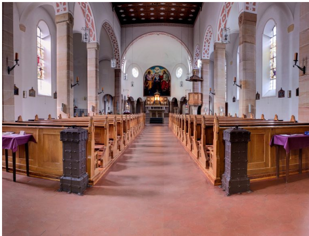
Innenansicht der Wallfahrtskirche des Wallfahrtsortes Maria Rosenberg in Waldfischbach-Burgalben. (Christian Weidler, 2013)

Raphaela Maertens am 27.11.2018 um 14:48:48Uhr