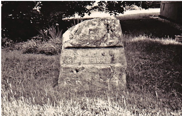
Ritterstein Nr. 52 mit der Inschrift "Eusserthaler Klostergut" und "PWV" (Erhard Rohe, 1993)