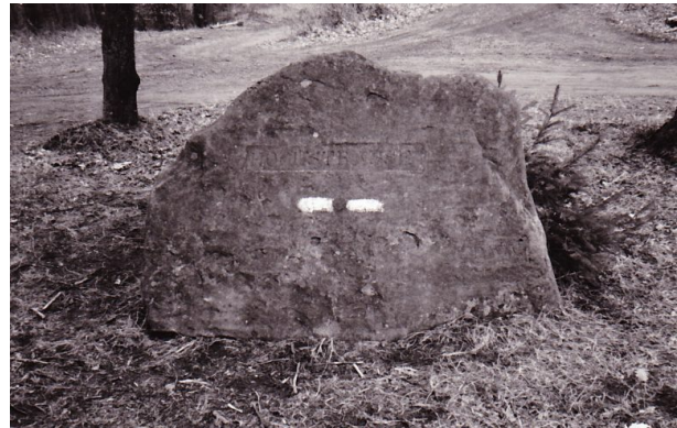
Ritterstein Nr. 160 bei Frankenstein mit der Inschrift "Hochstrasse" und "PWV" (Pfälzerwald-Verein). (Erhard Rohe, 1993)