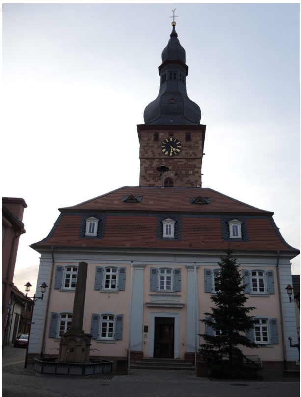
Frontansicht des ev. Gemeindehauses Göllheim (Andreas Hoch, 2019)