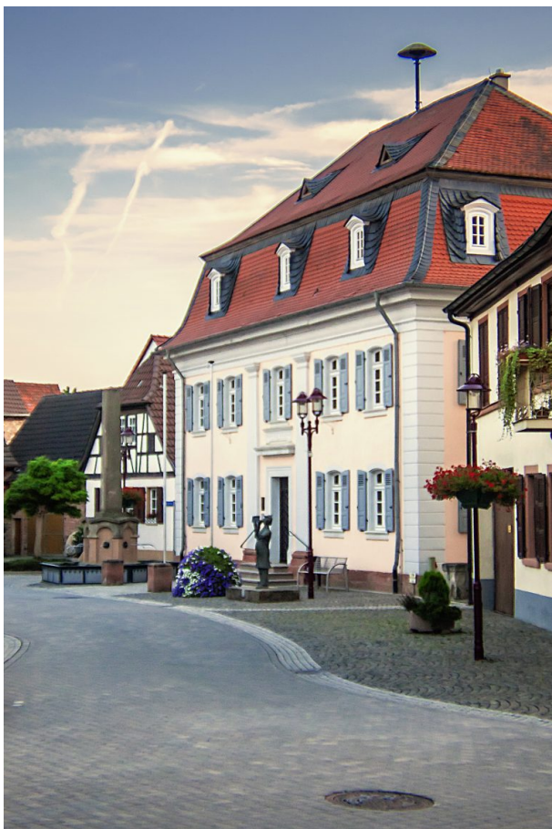
Altes Rathaus in Göllheim - heute evangelisches Gemeindehaus (Adolf Beck, 2015)

Gutenbergschule Göllheim am 27.01.2022 um 15:48:56Uhr