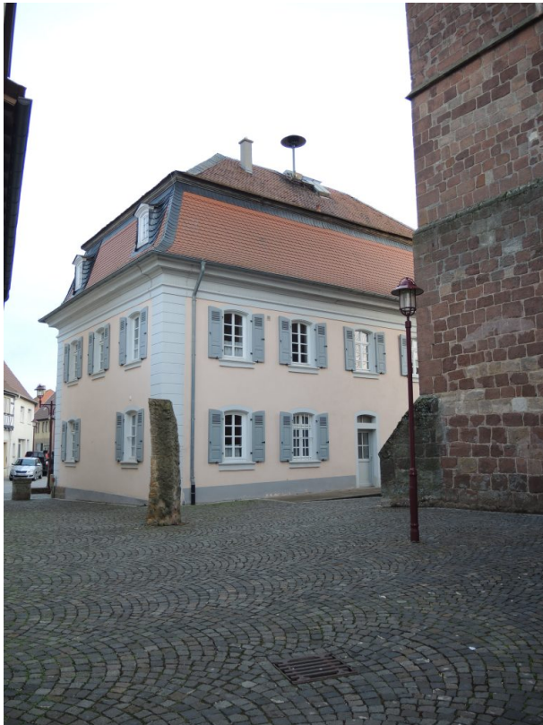
Außenfassade des ev. Gemeindehauses / Altes Rathaus Göllheim (Andreas Hoch, 2019)