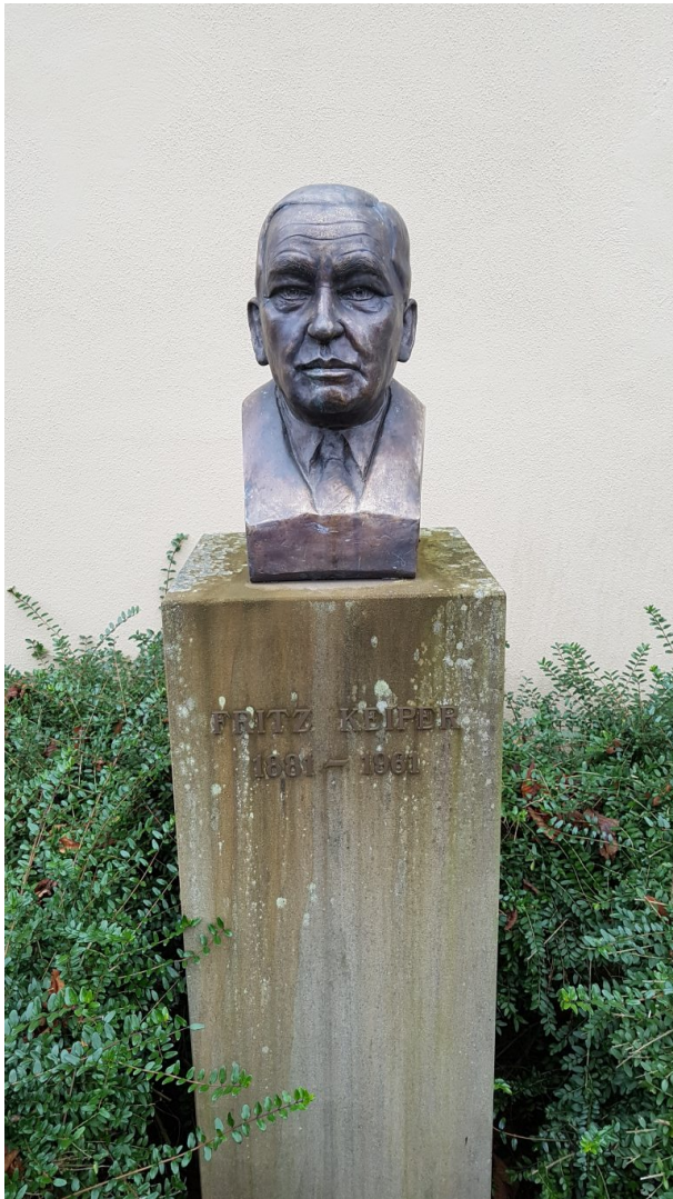
Büste von Fritz Keiper auf dem Keiper-Platz direkt neben dem Keiper-Haus (Arno Mohr, 2019)