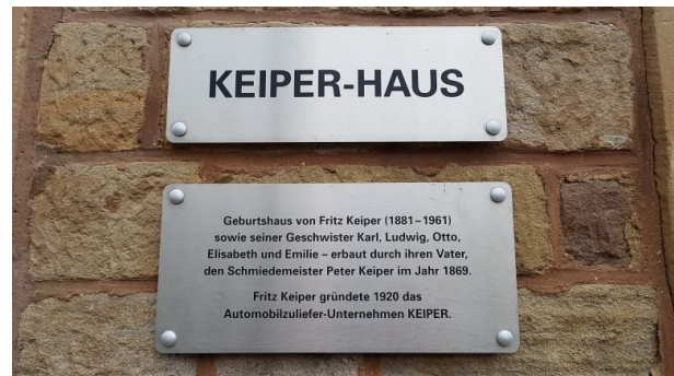
Metallschild an der Außenwand vom Keiper-Haus in Obermoschel (Arno Mohr, 2019)