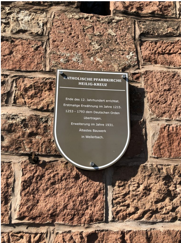
Informationstafel an der katholischen Kirche in Weilerbach (Dana Taylor , 2020)