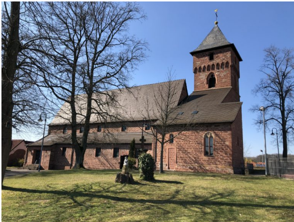
Katholische Kirche in Weilerbach (Dana Taylor, 2020)