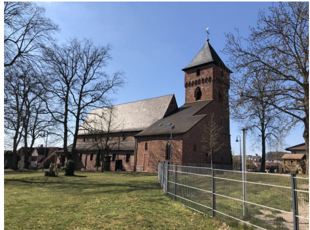
Blick von der Kirchstraße auf die katholische Kirche in Weilerbach (Dana Taylor, 2020)