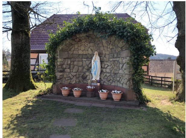
Mariengrotte an der katholischen Kirche in Weilerbach (Dana Taylor , 2020)