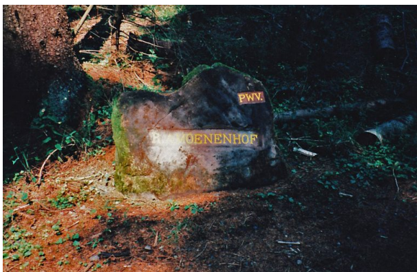
Ritterstein mit der Inschrift "R. Amoenenhof" bei Trippstadt (Erhard Rohe, 1995)

Marcel Krupka / Artur Bomke am 20.02.2020 um 09:09:47Uhr