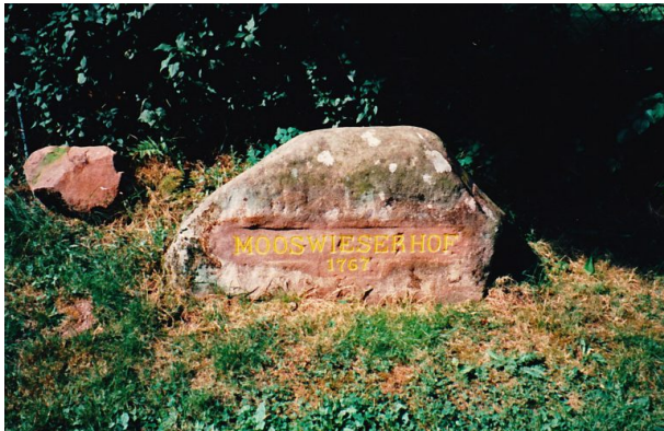
Ritterstein Nr. 133 bei Mölschbach mit der Inschrift "Mooswieserhof 1767" (Erhard Rohe, 1995)