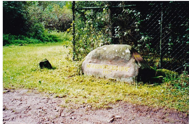
Ritterstein Nr. 133 bei Mölschbach mit der Inschrift "Mooswieserhof 1767" (Erhard Rohe, 2001)