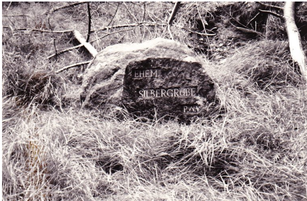
Ritterstein mit der Inschrift "Ehem. Silbergrube" bei Niederschlettenbach (Erhard Rohe, 1993)