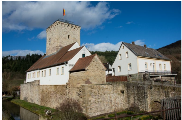
Wasserburg in Reipoltskirchen (Sonja Kasprick, 2020)