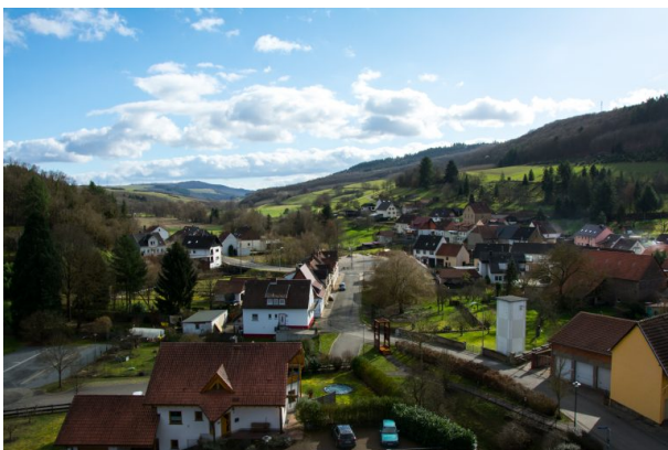
Ausblick vom Wehrturm über Reipoltskirche in Richtung Süden