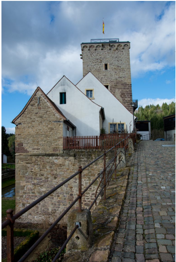
Blick von der Brücke in Richtung Wehrturm der Wasserburg (Sonja Kasprick, 2020)