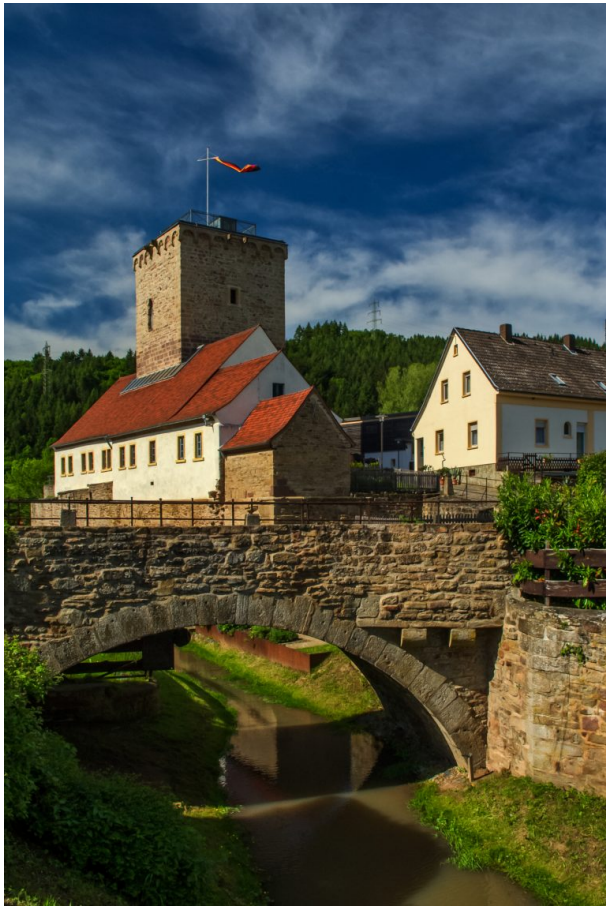
Die Wasserburg in Reipoltskirchen: Der Wehrturm stammt aus mittelalterlichen Zeiten. (Ralf Keller, 2015)