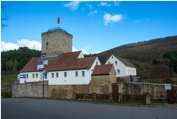
Wasserburg in Reipoltskirchen (Sonja Kasprick, 2020)