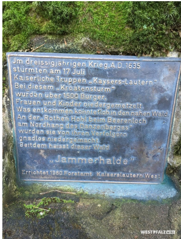
Gedenktafel Jammerhalde (Lukas Weitz, 2019)