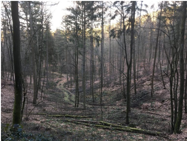
Der Sage nach soll alle sieben Jahre das Jammern der Ermordeten in diesem Teil des Waldes zu hören sein (Lukas Weitz, 2019)