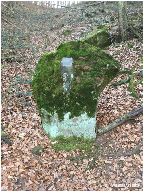
Der unscheinbare Gedenkstein klärt über den historischen Hintergrund der Jammerhalde auf

Lukas Weitz am 23.04.2019 um 09:43:41Uhr