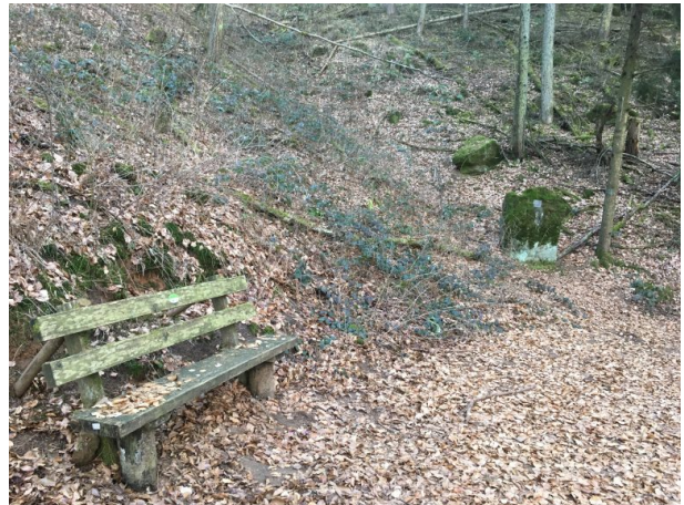
Bank und Gedenkstein Jammerhalde (Lukas Weitz, 2019)