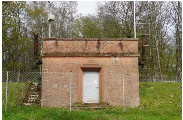
Überbaute Stelle der Otterburg (Dana Taylor, 2021)