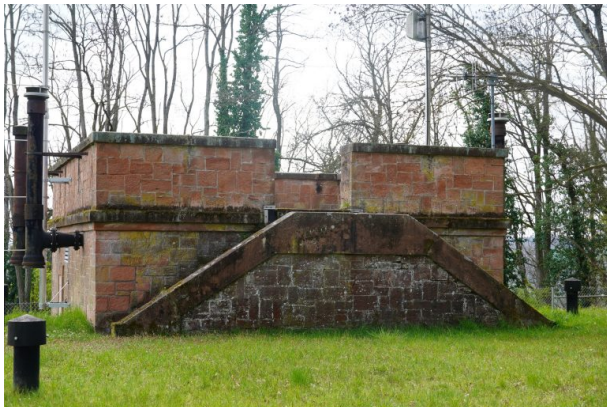
Überbaute Stelle der Otterburg (Dana Taylor, 2021)