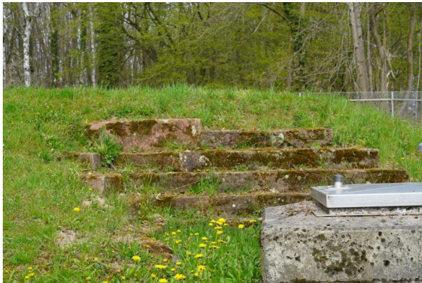
Mauerreste der ehemaligen Otterburg (Dana Taylor, 2021)