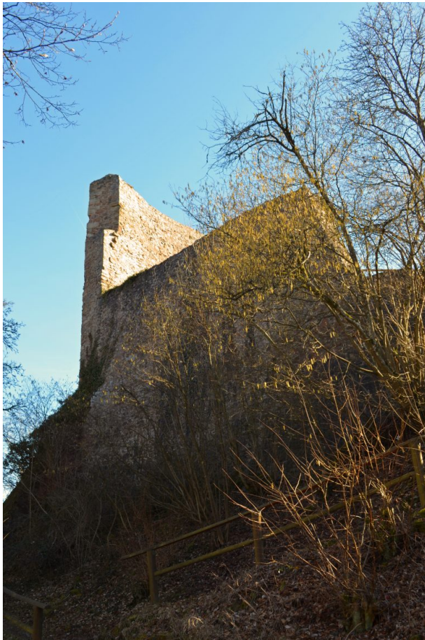
Ruine der Michelsburg aus Nordosten