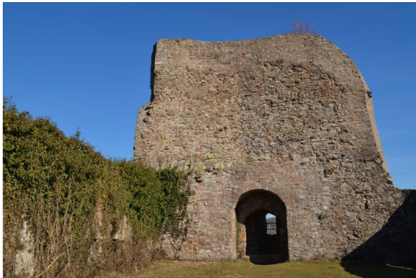
Blick in Richtung Osten auf die Reste der Bruchsteinschildmauer der Michelsburg (Dr. Hans-Günther Clev, 2019)