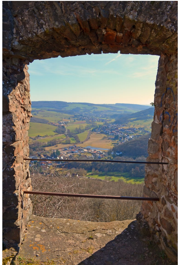
Blick aus einer der Fensteröffnungen der Michelsburg (Dr. Hans-Günther Clev, 2019)