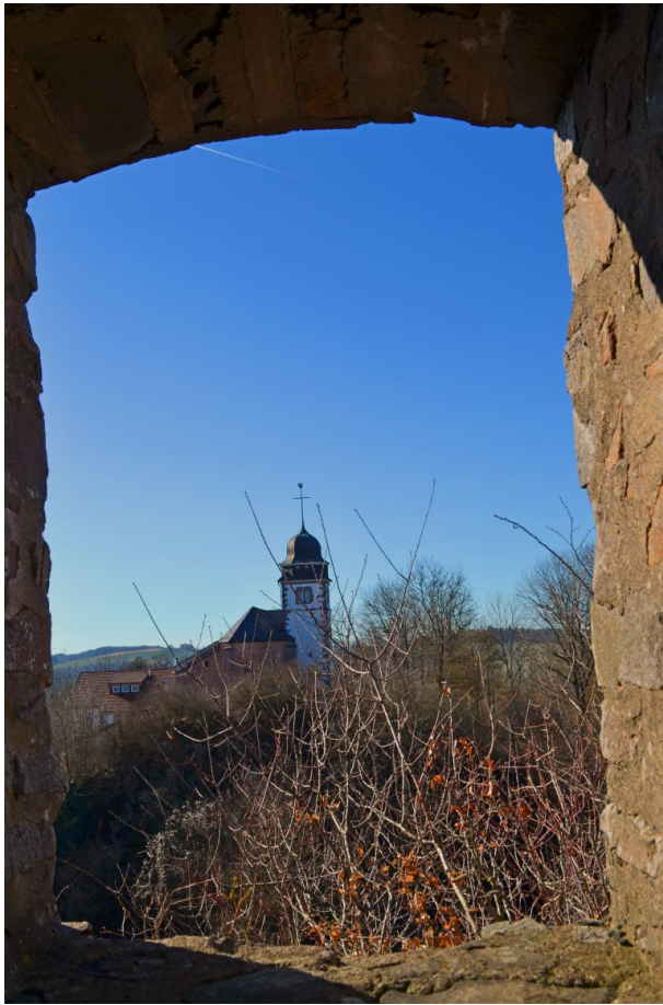
Blick von der Michelsburg auf die Probsteikirche St. Remigius (Dr. Hans-Günther Clev, 2019)