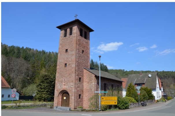
Blick von Süden auf die katholische Kirche in Waldleiningen (Dr. Hans-Günther Clev, 2020)

Raphaela Maertens am 17.07.2019 um 10:27:45Uhr