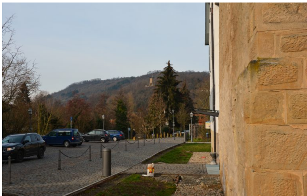
Kriegerdenkmal auf dem Igelkopf bei Lauterecken (Sonja Kasprick, 2019)