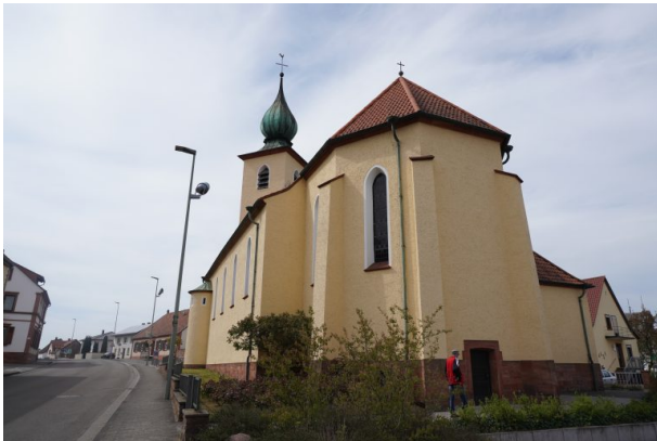
Rückansicht der katholischen Kirche in Hauptstuhl (Dana Taylor, 2020)