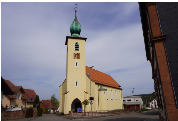
Frontansicht der katholischen Kirche in Hauptstuhl von der Kaiserstraße aus (Dana Taylor, 2020)

Raphaela Maertens am 20.08.2019 um 09:11:19Uhr