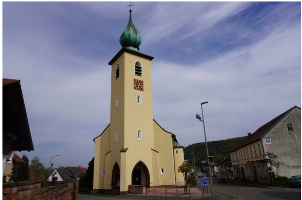
Kirchturm der katholischen Kirche in Bruchmühlbach (Dana Taylor, 2020)