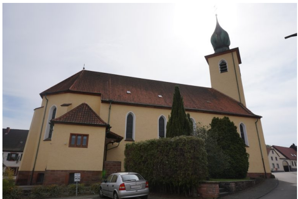
Seitenansicht der katholischen Kirche in Hauptstuhl (Dana Taylor, 2020)