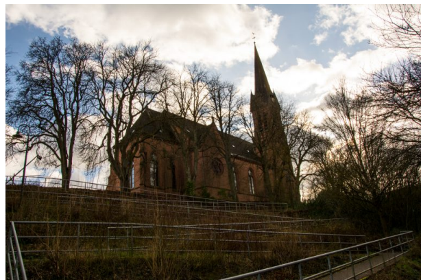
Südseite der katholischen Kirche in Otterbach mit Treppenaufgang (Sonja Kasprick, 2020)