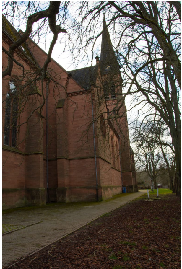
Das Langhaus der katholischen Kirche in Otterbach auf der Südseite (Sonja Kasprick, 2020)