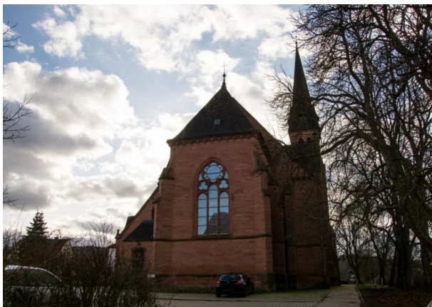
Blick auf die Westseite der katholischen Kirche in Otterbach (Sonja Kasprick, 2020)

Raphaela Maertens am 20.08.2019 um 11:15:16Uhr