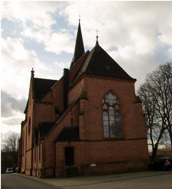
Blick auf die Westseite der katholischen Kirche in Otterbach (Sonja Kasprick, 2020)