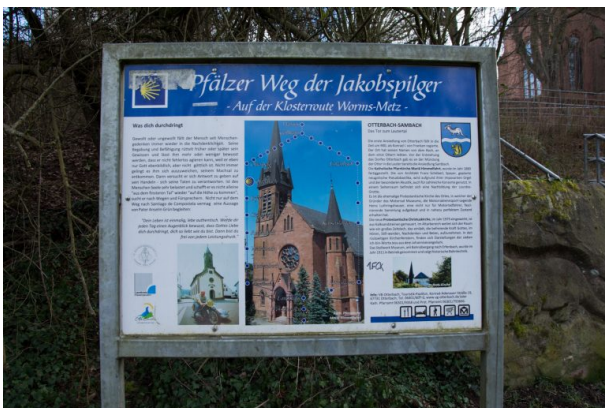
Informationstafel zum Jakobs Pilgerweg (Sonja Kasprick, 2020)