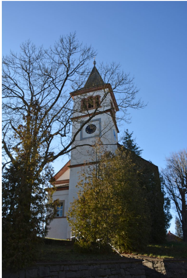
Kirchturm der protestantischen Kirche in Katzweiler (Ostansicht) (Arne Schwöbel, 2020)