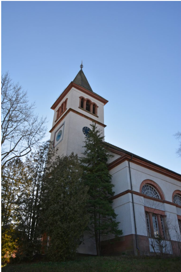
Kirchturm der protestantischen Kirche in Katzweiler (Arne Schwöbel, 2020)