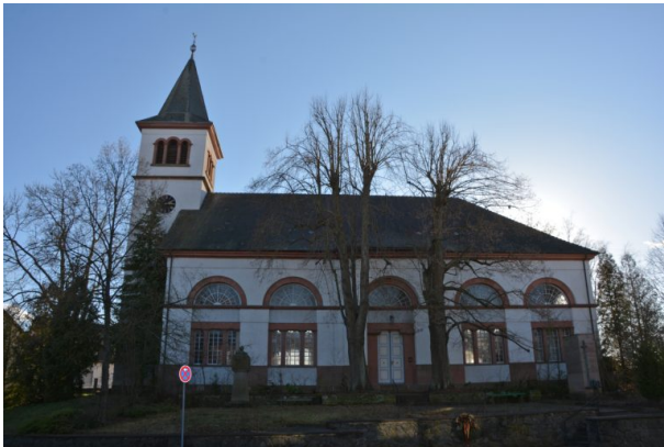
Nordansicht der protestantischen Kirche in Katzweiler von der Mehlbacher Straße (Arne Schwöbel, 2020)