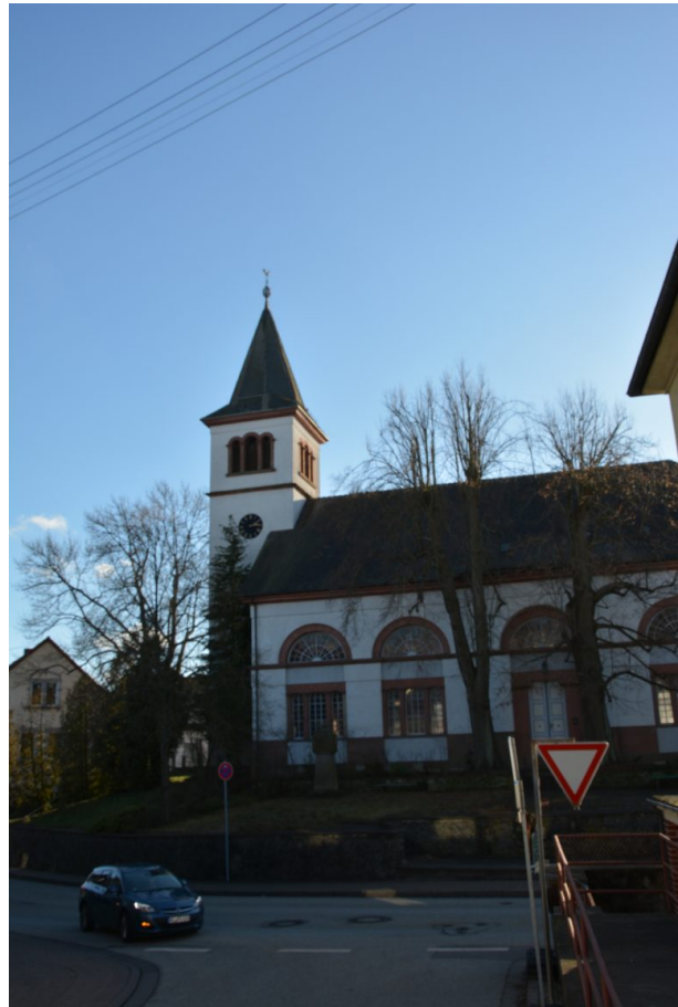
Nordansicht der protestantischen Kirche in Katzweiler von der Mehlbacher Straße (Arne Schwöbel, 2020)