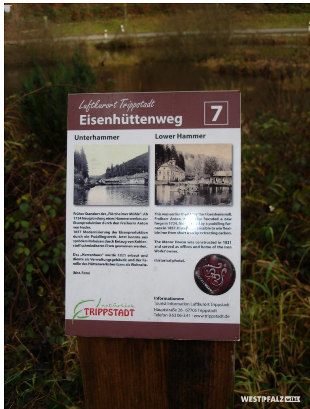
Informationsschild Nr. 7 am Unterhammer (Manfred Grad, 2016)