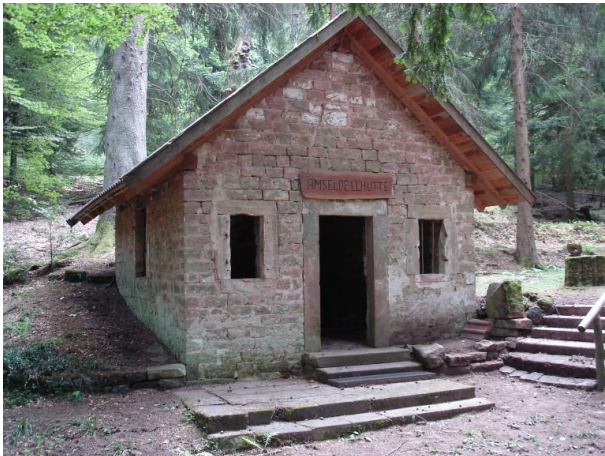
Amseldell - das übrig gebliebene Gebäude im Kegelbahn. (Manfred Grad, 2019)