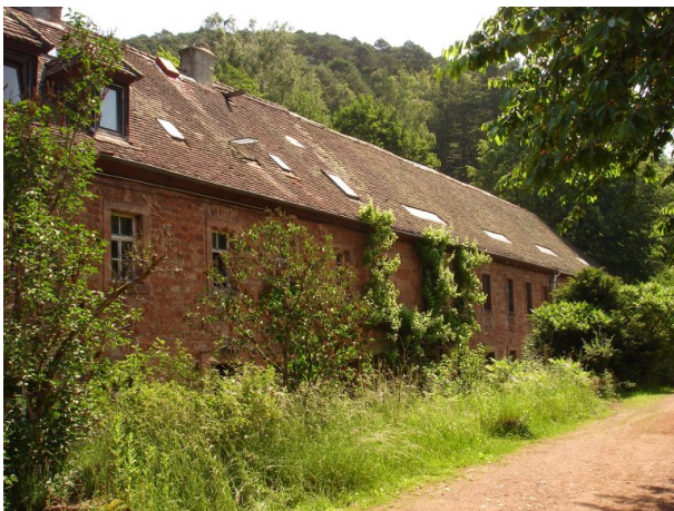
Ehemaliges Blech- und Walzwerk (Manfred Grad, 2018)