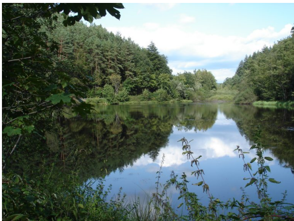
Der Oberhammer - die erste Produktionsstätte (Manfred Grad, 2019)