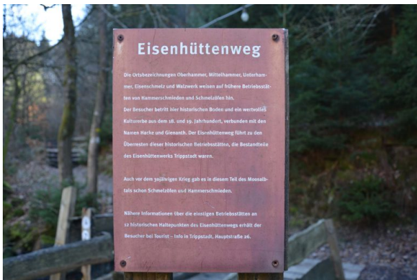
Infotafel zum Eisenhüttenweg an der Klugschen Mühle (Sonja Kasprick, 2019)