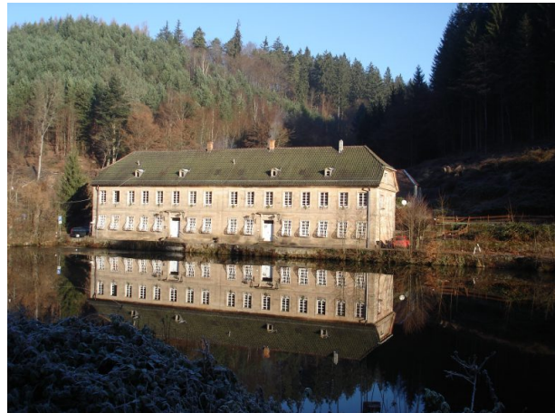
Herrenhaus am Unterhammer (Manfred Grad, 2019)