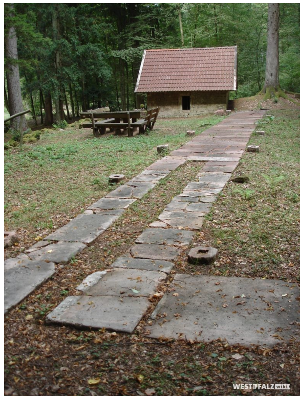
Amseldell - ehemaliges Erholungsgebiet und Treffpunkt von Gästen (Manfred Grad, 2019)