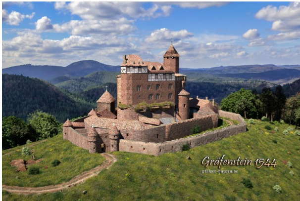
Rekonstruktion der Burg Gräfenstein um 1544 von Peter Wild (pfälzer-burgen.de)