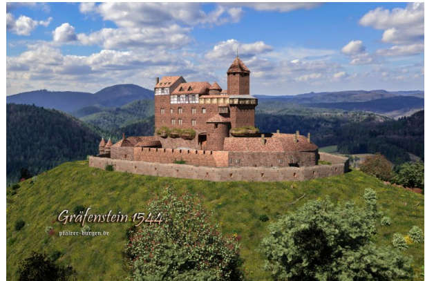
Rekonstruktion der Burg Gräfenstein um 1544 von Peter Wild (pfälzer-burgen.de)