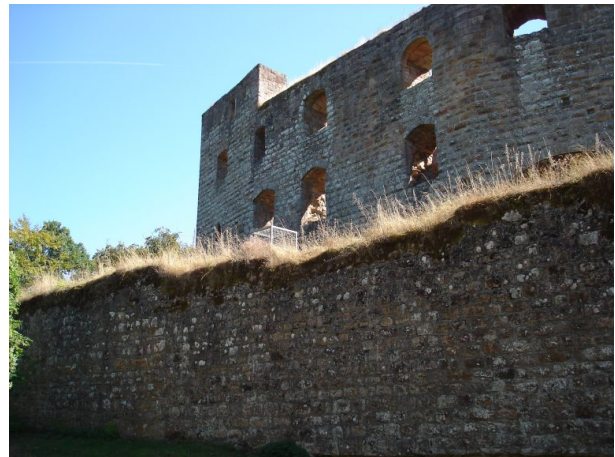
Blick aus Westen auf den Wohnpalas (Manfred Grad, 2019)