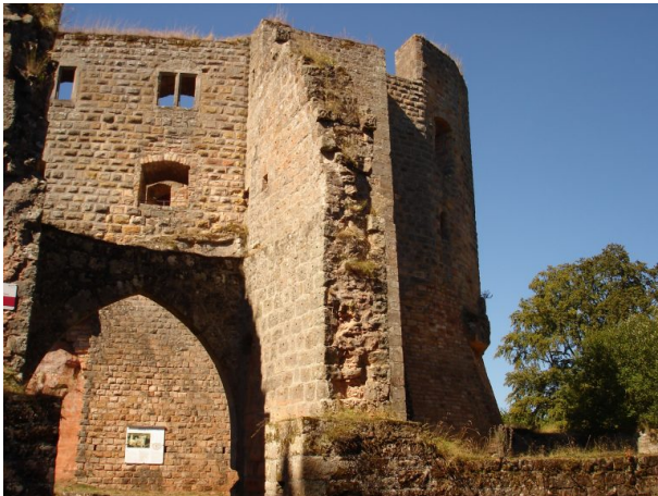
Blick durch das zweite Eingangstor mit spitzbogigem Durchgang. Im Hintergrund die Westseite des Wohnpalas (Manfred Grad, 2019)