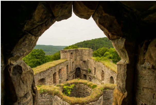
Burg Gräfenstein bei Merzalben (Torben Fruth, 2015)