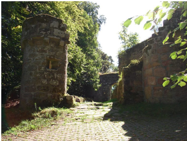
Erstes Eingangstor mit zwei gut erhaltenen Türmen rechts und links. (Manfred Grad, 2019)