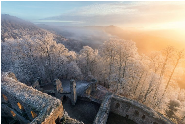
Blick von der Burg Gräfenstein im Winter (Jens Theobald, 2018)