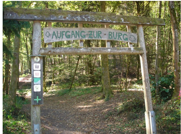
Eingangstor unterhalb der Burg (Manfred Grad, 2019)