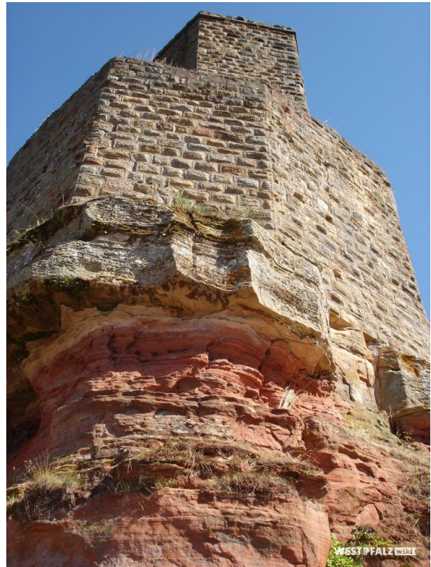
Bergfried und Mantelmauer (Manfred Grad, 2019)