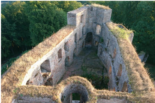
Palas in der Oberburg vom Bergfried. Im Vordergrund der Treppenturm (Manfred Grad, 2017)