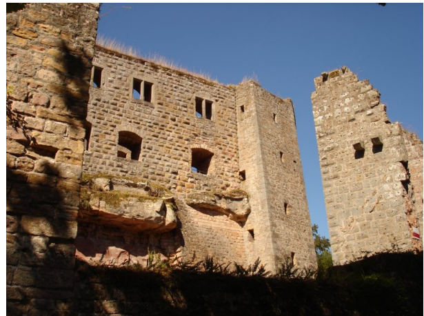
Blick aus Westen auf den Wohnpalas mit Abortturm. Am rechten Bildrand ist die Turmruine zu sehen, in der sich das zweite Eingangstor zur Unterburg befindet. (Manfred Grad, 2019)