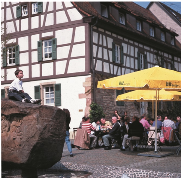
Gasthaus Krone in Otterberg (VG Otterbach-Otterberg, 2019)

Dana Taylor am 09.10.2019 um 14:12:02Uhr