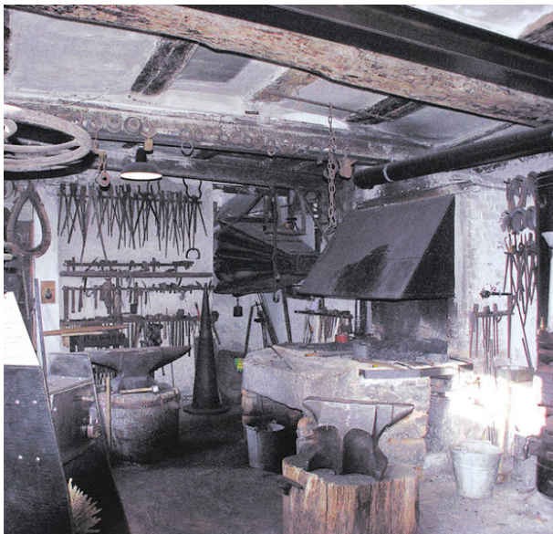
Schmiede Theis in Otterberg (VG Otterbach-Otterberg, 2019)

Dana Taylor am 07.10.2019 um 09:44:28Uhr