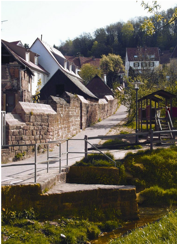
Teil der Stadtmauer parallel zur Lauerstraße in Otterberg (VG Otterbach-Otterberg, 2019)

Dana Taylor am 10.10.2019 um 15:51:47Uhr