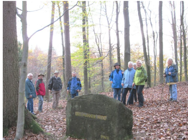
Ritterstein Nr. 193 mit der Inschrift "Drei-Männer-Weg" (Albert Nagel, 2013)