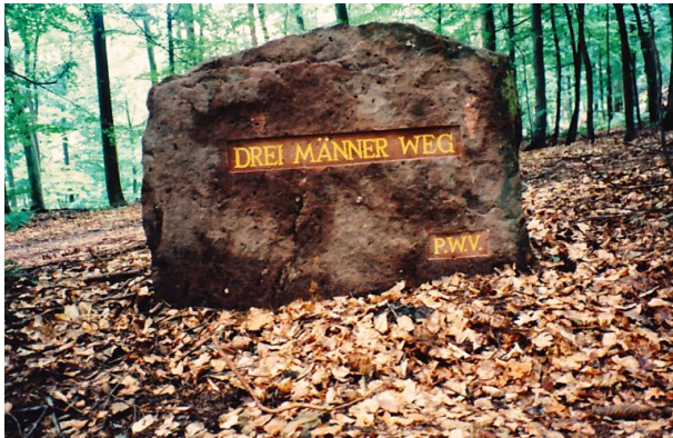
Ritterstein Nr. 193 mit der Inschrift "Drei-Männer-Weg" (Erhard Rohe, 1994)